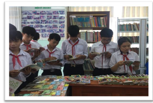
Thư viện tỉnh Phú Yên